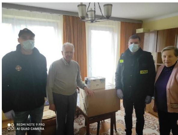
Fot. 11 Wręczenie gotowej paczki w ramach akcji „Paczka dla Bohatera”