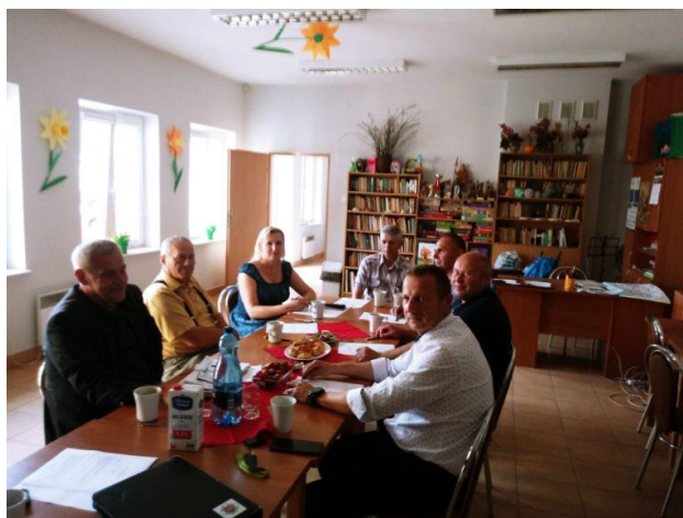
Fot. 8 Spotkanie powiatowego Klub Kronikarza OSP Powiatu radomskiego