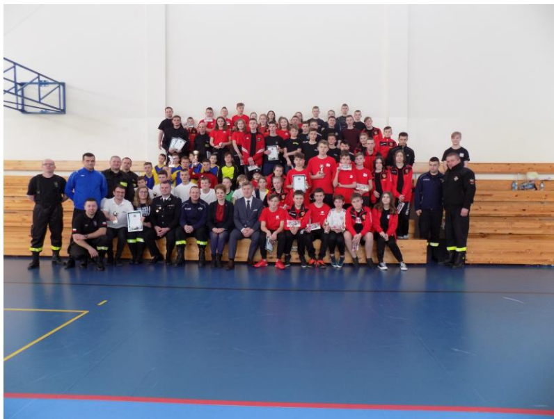
Fot. 1 Halowy Turniej Piłki Nożnej Młodzieżowych Drużyn Pożarniczych

Patronat honorowy nad turniejem objęli: Starosta Radomski oraz Wójt Gminy Wolanów. Zwycięskie drużyny otrzymały cenne nagrody, które zostały ufundowane przez: Starostwo Powiatowe, Urząd Gminy Wolanów oraz firmy współpracujące z Zarządem.