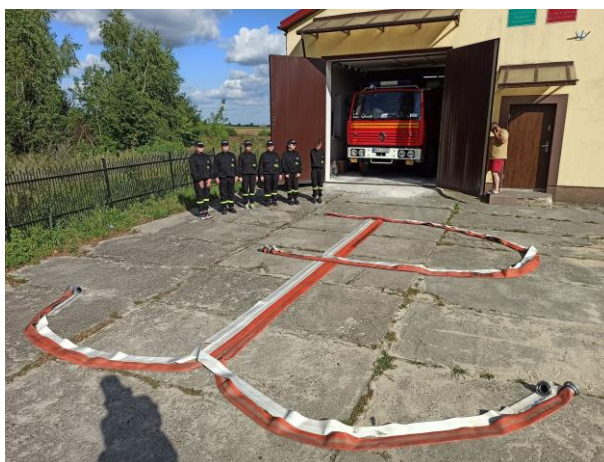
Fot. 9 Upamiętnienie Godzina W – 76. rocznicy Wybuchu Powstania Warszawskiego w wykonaniu MDP Wierzbica-Kolonia

Jednostki z terenu powiatu radomskiego upamiętniły 76 rocznicę wybuchu powstania warszawskiego. Do akcji włączyły się: OSP Cerekiew, OSP Czarna, OSP Przytyk, OSP Jedlnia – Letnisko, OSP Wierzbica-Kolonia, OSP Skaryszew, OSP Makowiec, OSP Strzałków, OSP Pionki, OSP Ruda Mała.