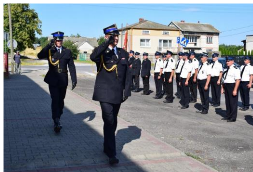
Fot. 6,7 Apel z okazji włączenia jednostek OSP Łączany i OSP Cerekiew do KSRG