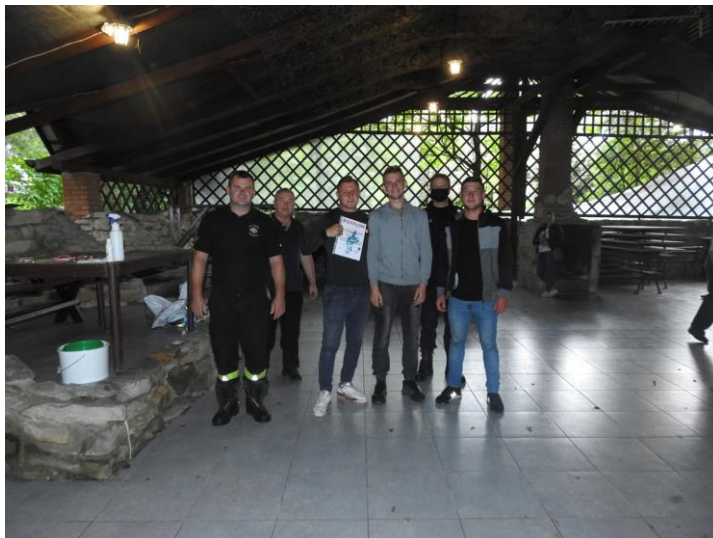
Fot. 2 Zawody w Wędkarstwie Spławikowym

Celem imprezy jest propagowanie wśród dzieci, młodzieży oraz dorosłych strażaków idei wędkarstwa rekreacyjnego, jako alternatywnej formy spędzania czasu wolnego i czynnego wypoczynku oraz dbałości o środowisko naturalne, jako nasze wspólne dobro. Zwycięskie drużyny otrzymały cenne nagrody, które zostały ufundowane przez: Zarząd Oddziału Powiatowego ZOSP RP w Radomiu oraz firmy współpracujące z Zarządem.