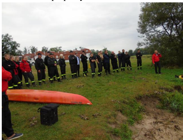
Fot. 5 III Powiatowe Spotkania Opiekunów i członków MDP

Na zakończenie spotkania odbył się pokaz z ratownictwa wodnego oraz użytkowanie podręcznego i ciężkiego sprzętu ratownictwa wodnego w wykonaniu druhów z Ochotniczej Straży Pożarnej w Przytyku i ratowników z Środowiskowo-Lekarskiego Wodnego Ochotniczego Pogotowia Ratunkowego w ramach współpracy .